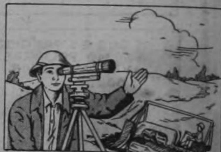
CONSEJOS AL AGRICULTOR REGIONAL