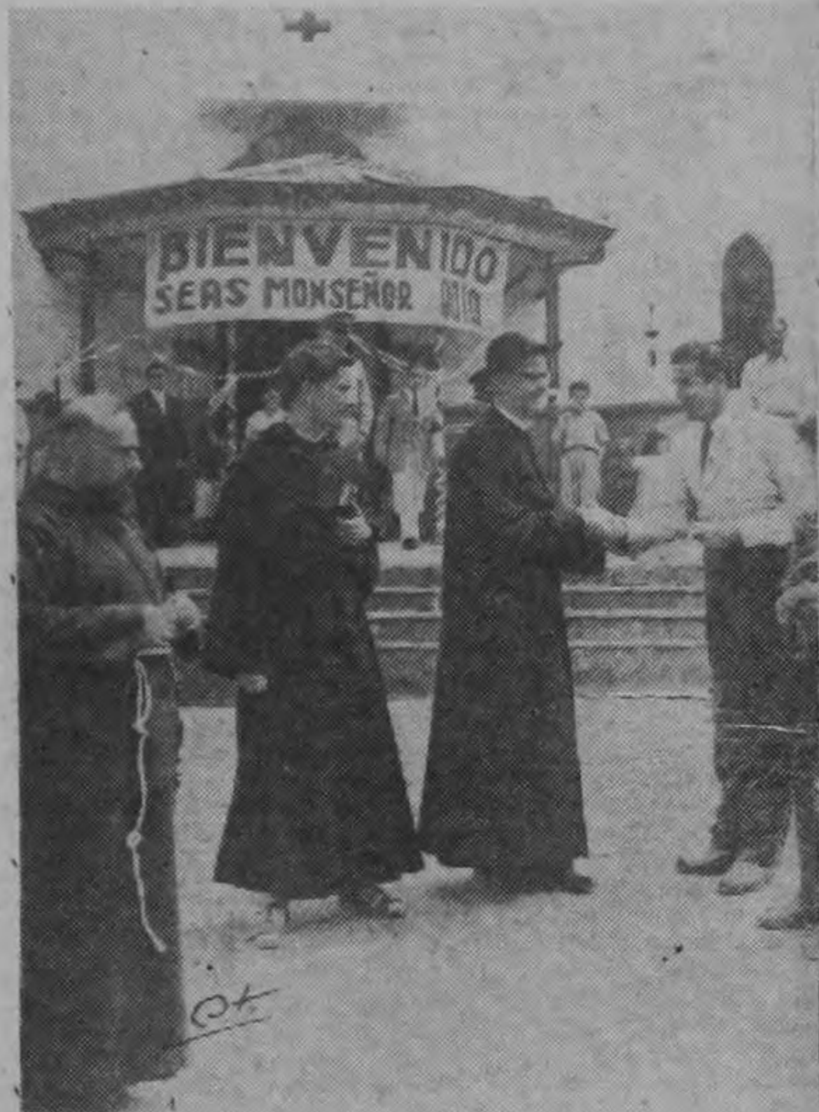
CONGRESO EUCARISTICO.—Monseñor Rubén Odio, Arzobispo de San José, recibe los saludos del Comandante Romero al retirarse de la Penitenciaría, después de haber realizado con su presencia las actuaciones de clausura del Congreso Eucarístico que se llevó a cabo en ese establecimiento penal.—(Foto Coto).