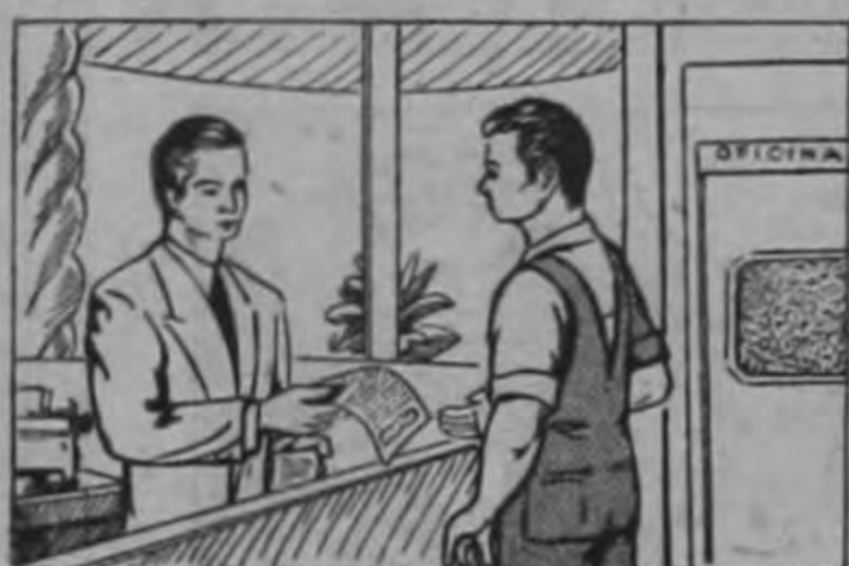
CREDITO (A Mediano y Largo Plazo)