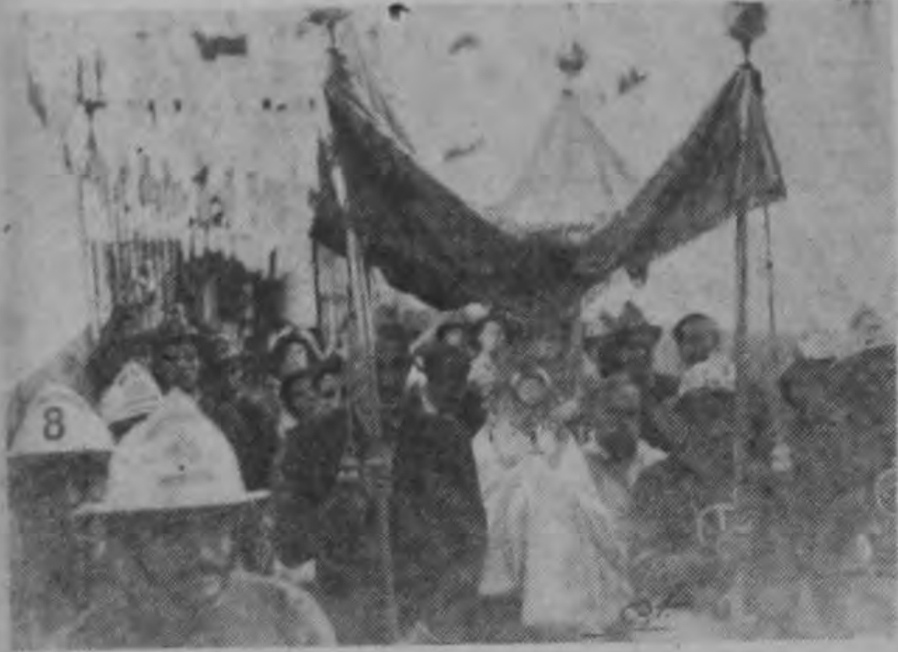
Un aspecto de la procesión realizada ayer en la Penitenciaría, poniendo término a las ceremonias de realización del Congreso Eucarístico en ese establecimiento penal.

Quién le pondrá freno a los desmanes de las Cías? La FETRABA hace hasta donde puede; quiere el Estado hacer lo que le corresponde?