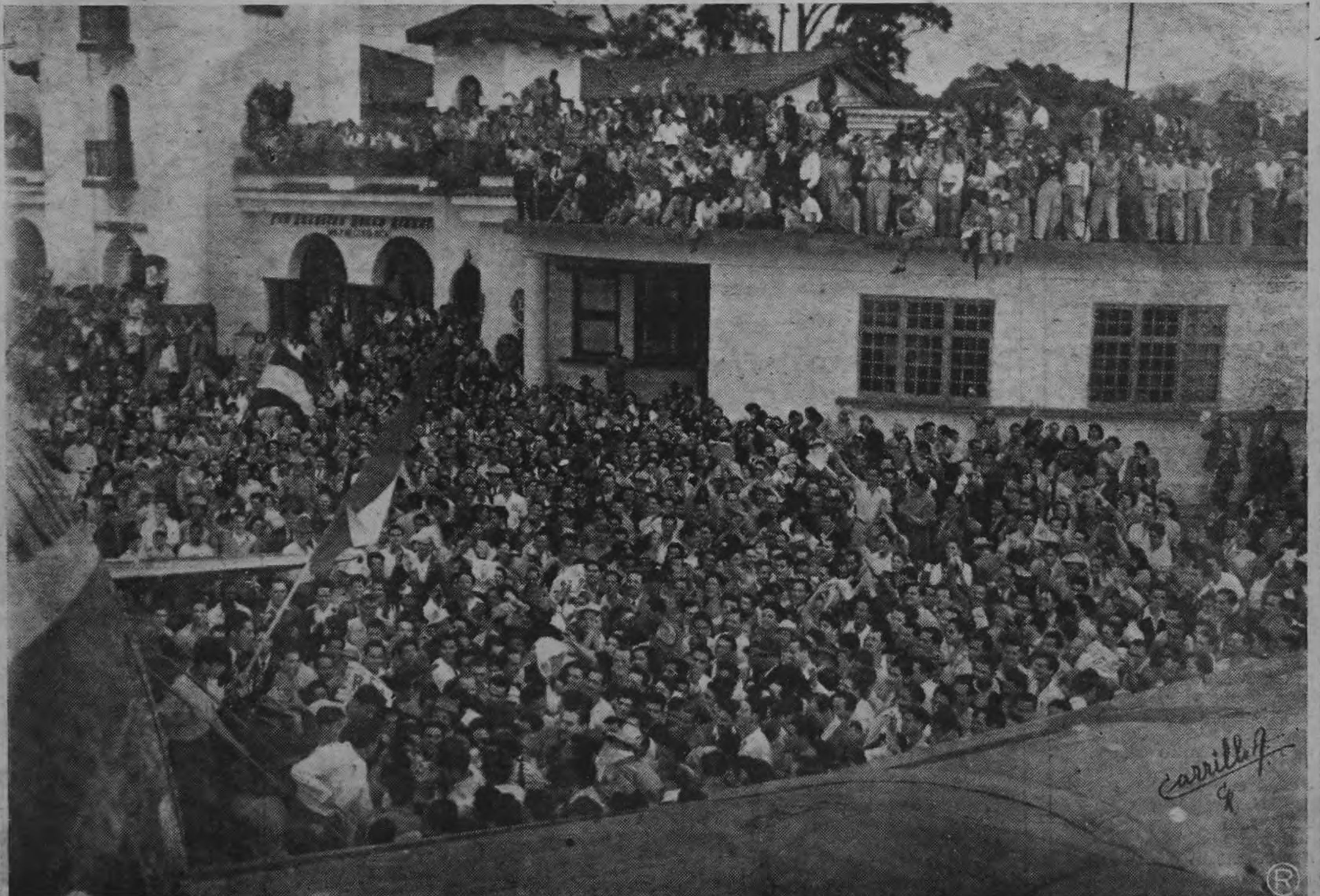
Miles de josefinos figueristas se movilizaron en pocos minutos para rendirle fervoroso recibimiento a don José Figueres en el Aeropuerto de La Sabana cuando regresó el año pasado de La Habana. La capital como todo el país es figuerista.