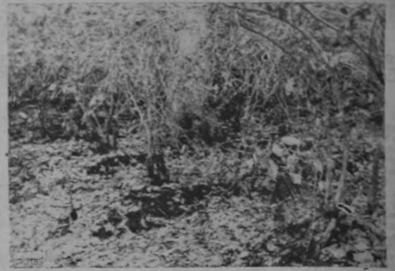
Es éste el espectáculo en un cafetal muy afectado por el "Ojo de Gallo": Plantas desvestidas, café caído y producción reducida en gran porcentaje.

En áreas de 2 a 8 manzanas, una o dos atomizaciones de espalda. —Pasa a la PAGINA 15—