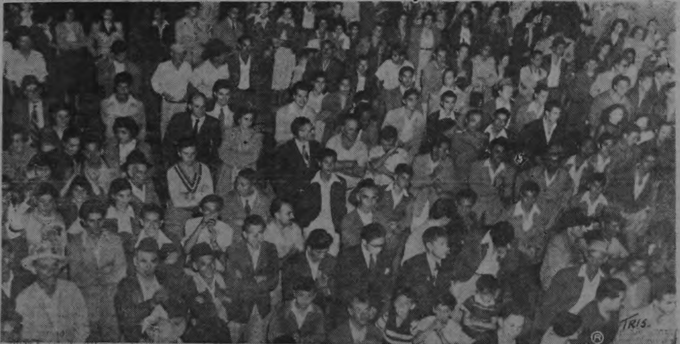
Barrio México está listo para concurrir a las urnas del sufragio para contribuir a la victoria electoral de José Figueres.