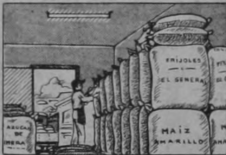
PRECIO FIJO (Protegiendo al Productor y al Consumidor)