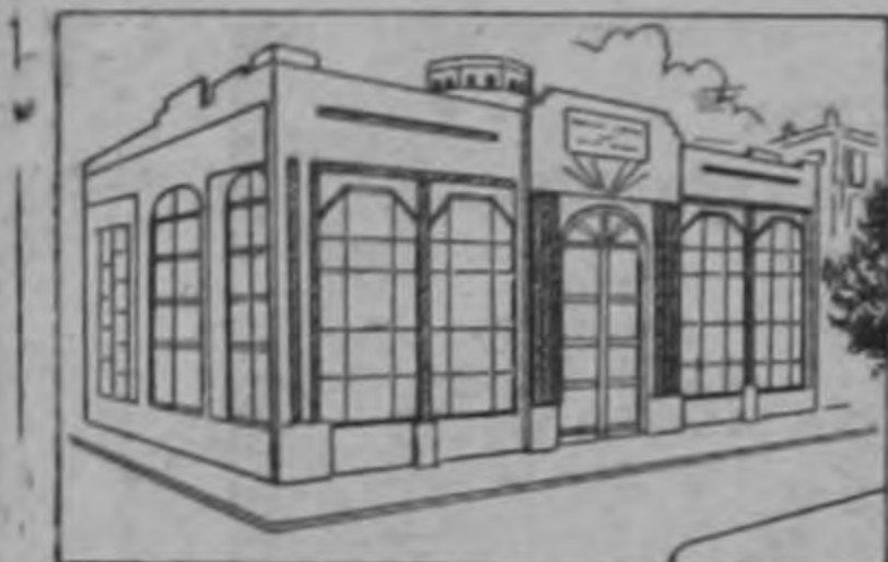
SISTEMA BANCARIO NACIONAL