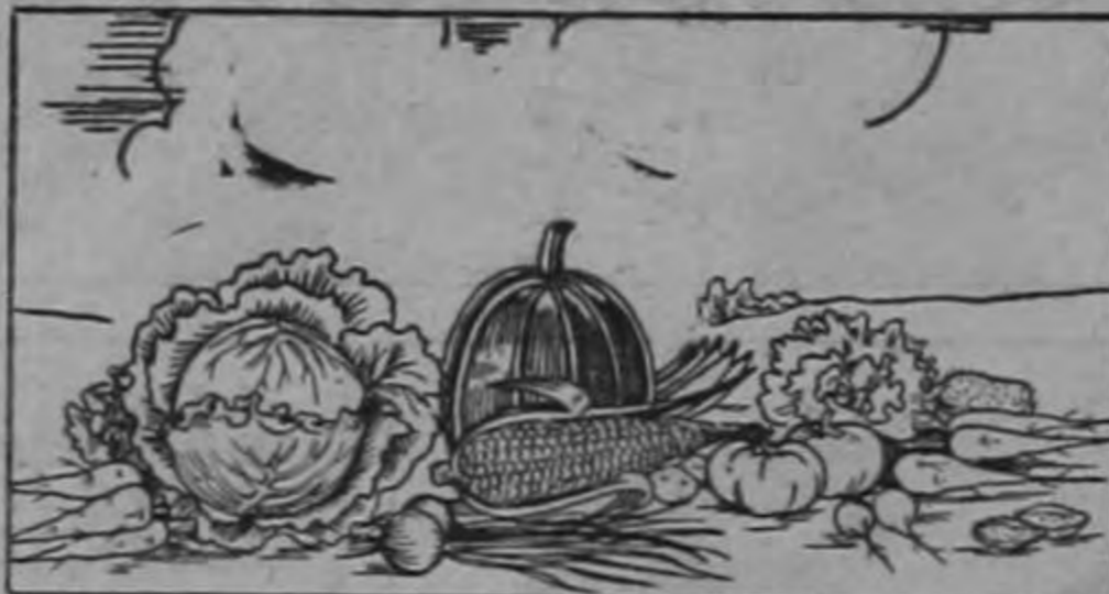
MAS PRODUCCION POR MANZANA MAS PRODUCTIVIDAD POR DIA DE TRABAJO