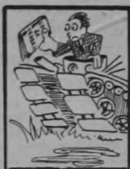
Tendrán que ir en tanques.