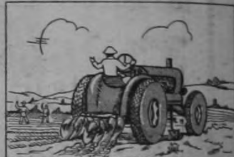
STICA-MINISTERIO DE AGRICULTURA