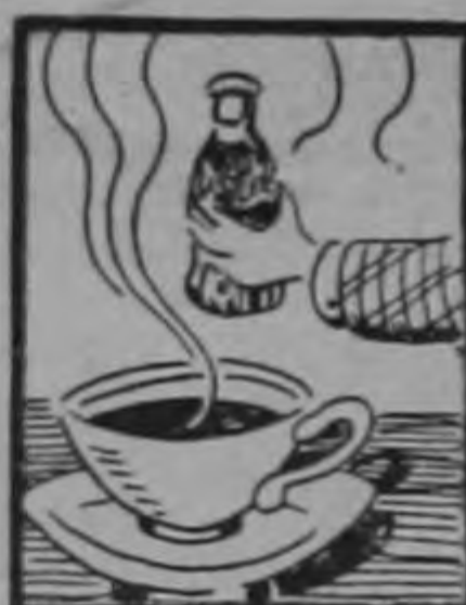
Tomarán Coca Cola.