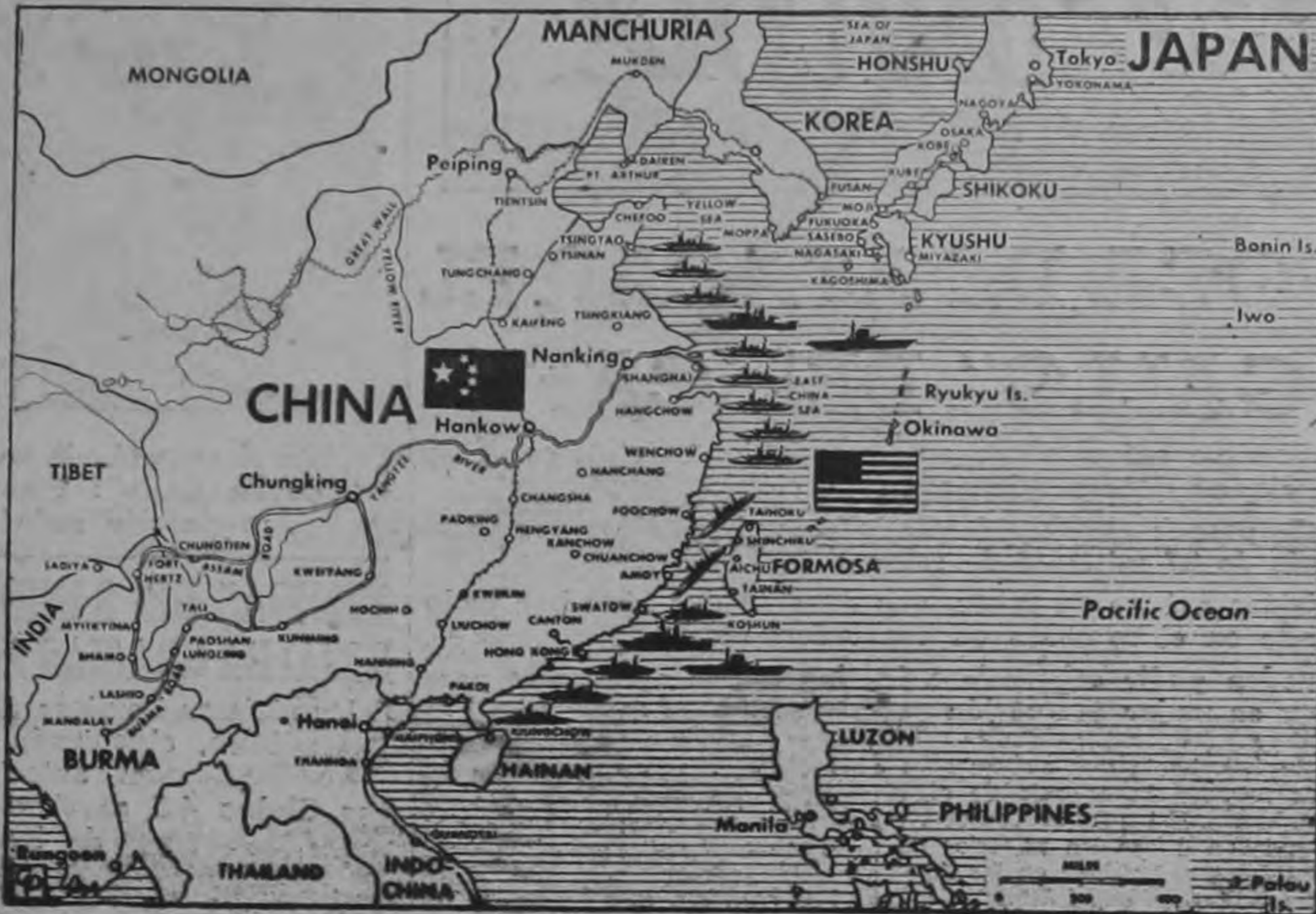
Este mapa de Prensa Central indica el área en que se efectuaría un posible bloqueo americano de China.

Se vigilaba a las embarcaciones que se encontraban en los estrechos, pero sin interferir con el movimiento normal de navegación. La Armada Nacionalista China,