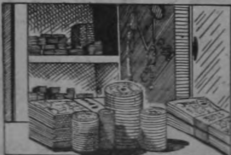
MAS RIQUEZA NACIONAL (De todos los Costarricenses)