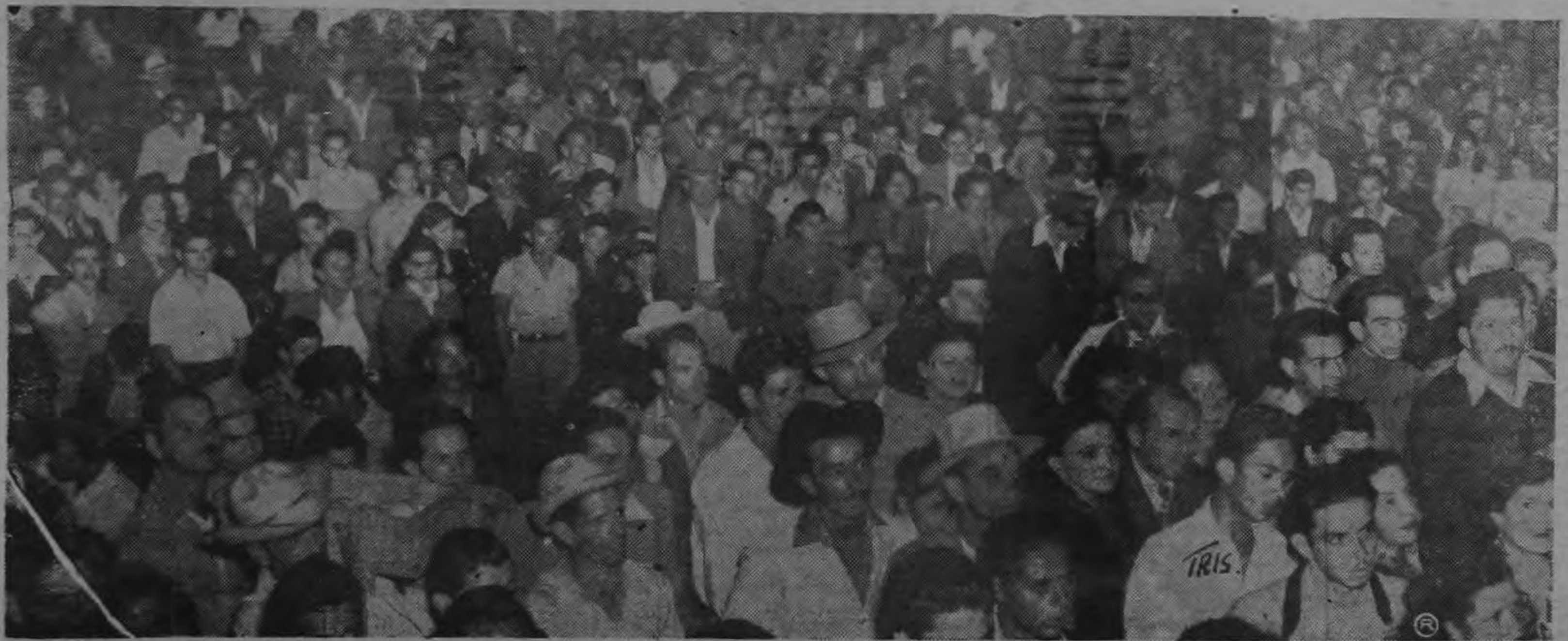
Aquí están los hombres y mujeres de Barrio Cuba, sus adhesiones y sus votos mañana...