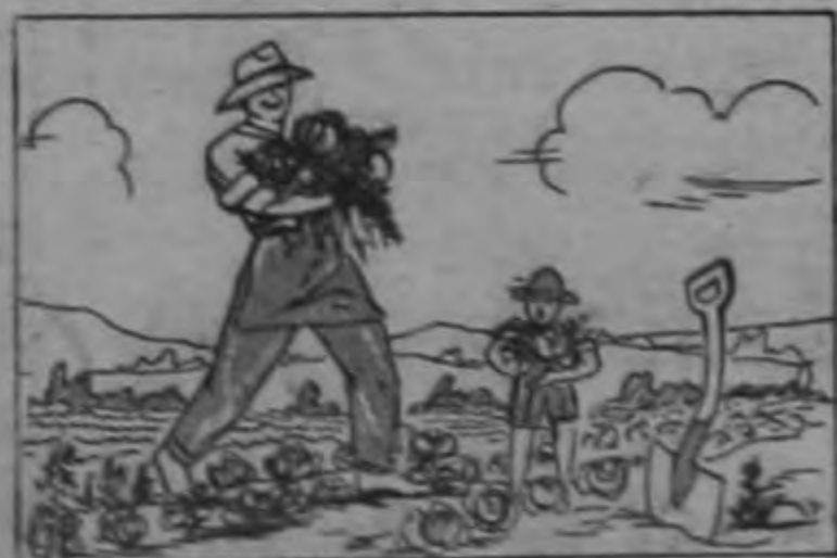
AUMENTO DE CULTIVOS (Y de la Productividad)