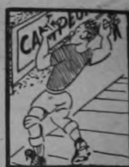
Poniendo los últimos clavos a la placa de campeón.