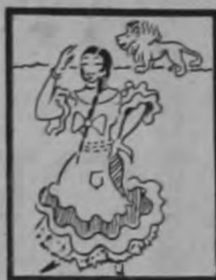
Las leonas estuvieron requetebien