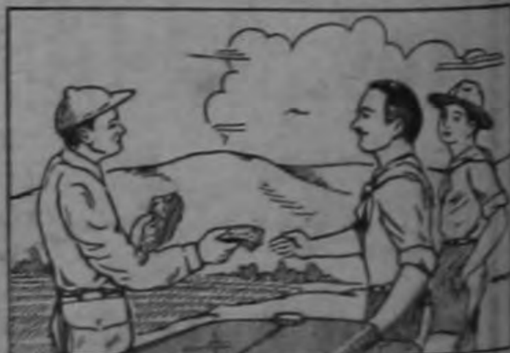
MEJORES SALARIOS (A los Trabajadores)